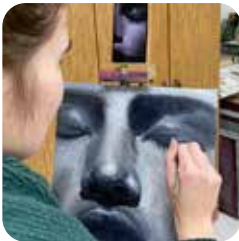
Teken- en schilder cursus