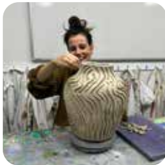
Keramik handvorm cursus